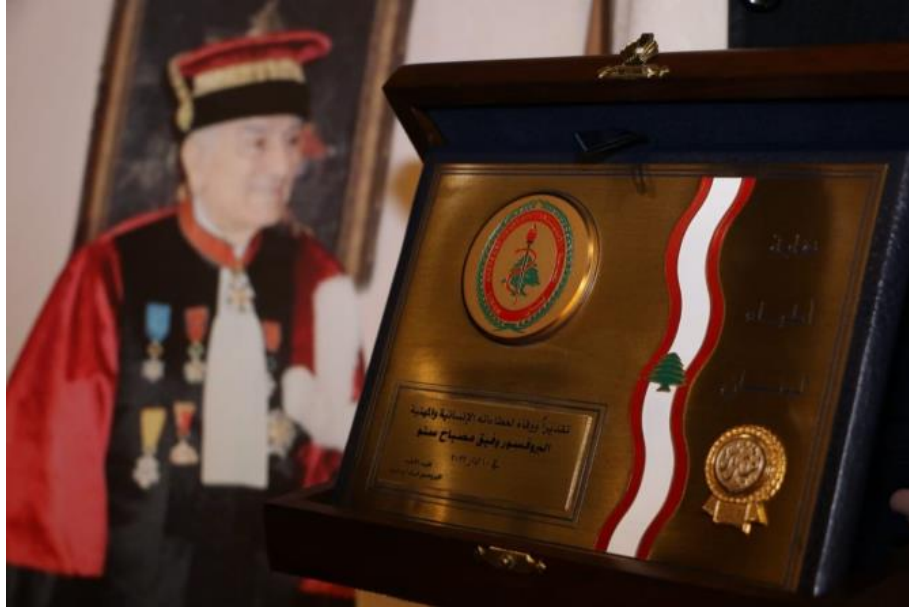
المرحوم البروفسور وفيق مصباح سنو

وختم اللقاء بكلمة لوزير الصحة القاها ممثله دكتور جهاد مكوك معدداً مزايا الفقيد الكبير.