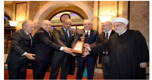
تقديم الدرع التكريمي للمحتفى به