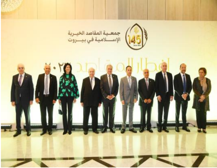
مجلس أمناء جمعية المقاصد