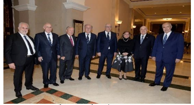
صورة تذكارية بالمناسبة