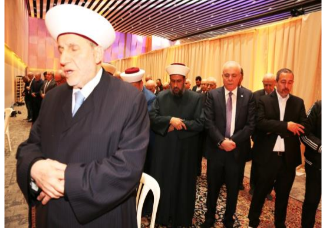
المفتي مالك الشعار يؤم بالمصلين