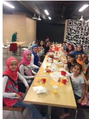
إفطار في فندق الدون