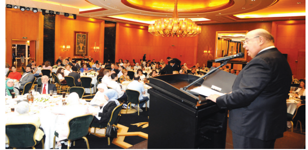
رئيس الجامعة يلقي كلمته