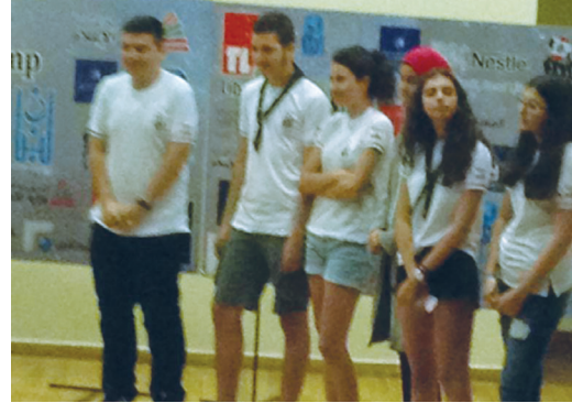
المجموعة المشاركة في برنامج الريادة