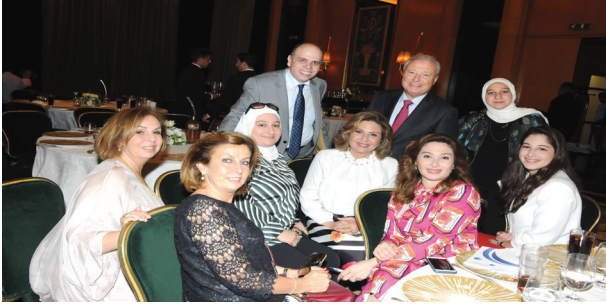
كوكبة من نساء الجامعة