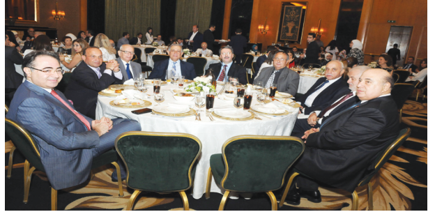
رئيس الجامعة مع اتحاد العائلات البيروتية