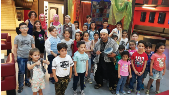
صورة مع الطبال