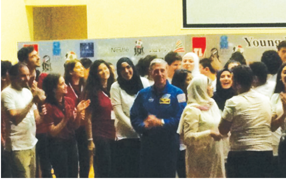
المجموعة مع رائد الفضاء دونالد توماس