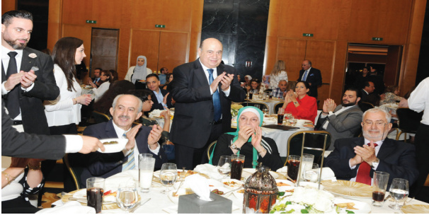
رئيس الجامعة يجول بين الحضور