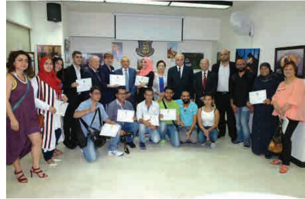
صورة جامعة لجميع الفنانين المصورين مع شهادات التقدير