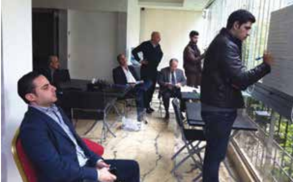
خلال عملية الفرز