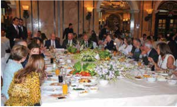
جانب من طاولة الشرف