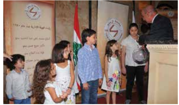
أطفال آل سنو والأنسباء يختارون أسماء رابحي الهدايا المقدمة من رئيس وأعضاء الهيئة الإدارية للجامعة