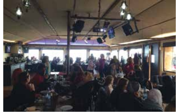
الغداء في مطعم دير القمر بمناسبة عيد الأم في ١٣ آذار ٢٠١٤