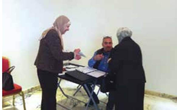
خلال عملية الإقتراع