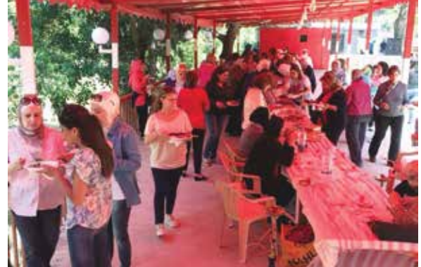
رحلة غداء الى "عيون السمك" في عكار في ١٥ أيار ٢٠١٤