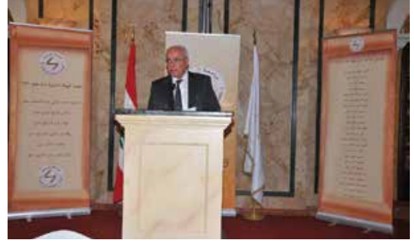
رئيس الجامعة الدكتور فيصل سنو يلقي كلمة ترحيبية